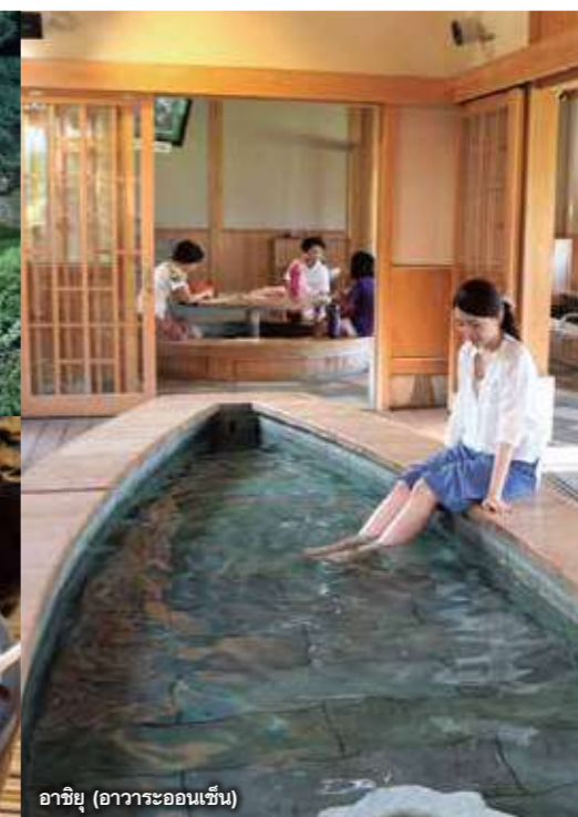
อาชิยุ (อวาระออนเซ็น)