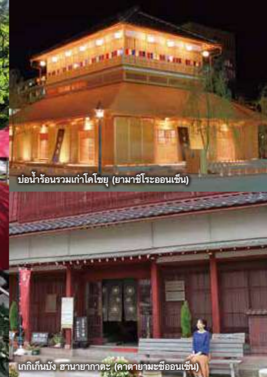
บ่อน้ำร้อนรวมเก่าโคโซยุ (ยามาชิโรออนเซ็น)