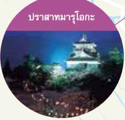
ปราสาทมารุโอกะ