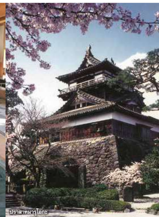
ปราสาทมารุโอะกะ