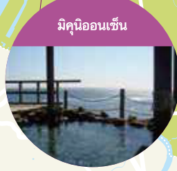
มิกุโนออนเซ็น