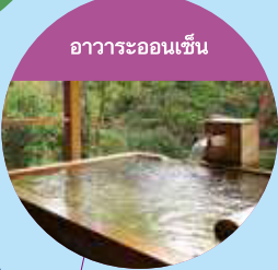
อวาระออนเซ็น