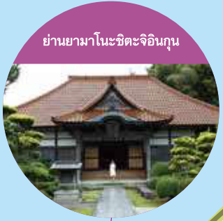
ย่านยามาโมะโนะชิชะจิอินงุน