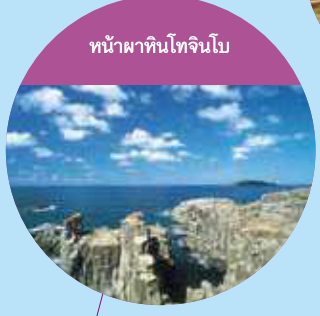
หน้าผาทันโทจินโบ