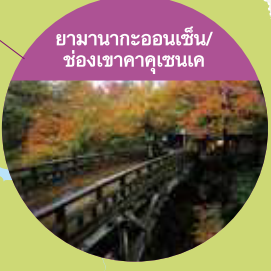
ยามาซากะออนเซ็น/ ยองเซคาคุเซนเคค