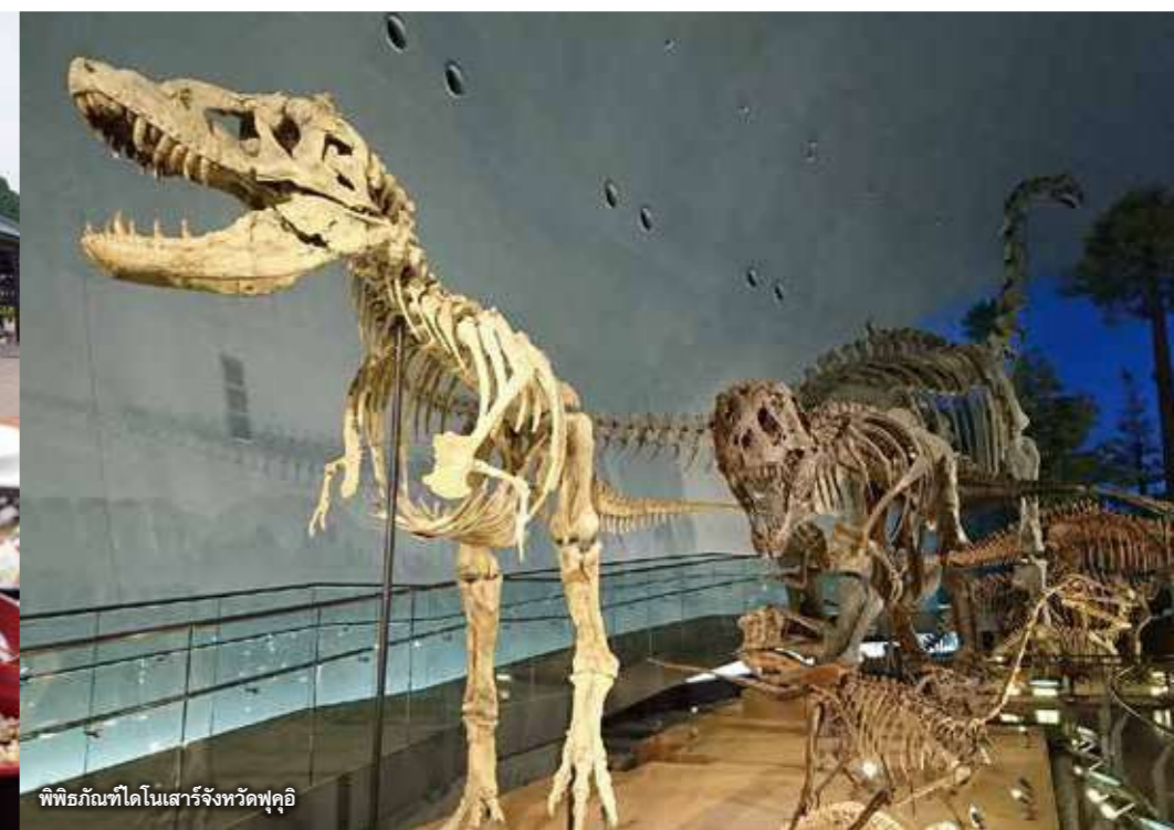
พิพิธภัณฑ์ไดโนเสาร์จังหวัดฟูคูอิ