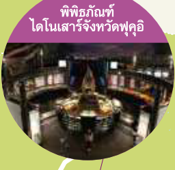
พิพิธภัณฑ ไดโนเสาร์จังหวัดฟุคุอิ