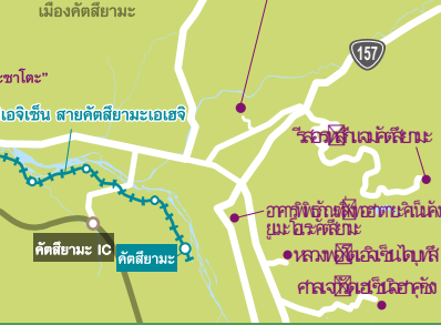
เมืองคัตสึยามะ