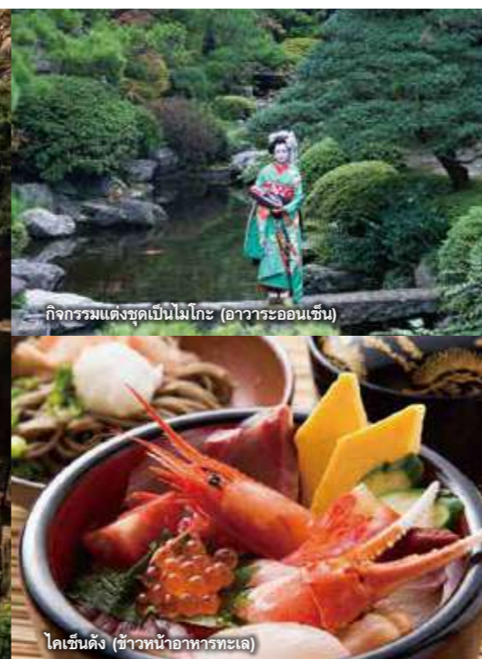
กิจกรรมแต่งชุดเป็นไมโกะ (อวาระออนเซ็น)