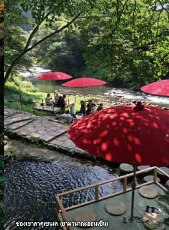
ช่องเขาคุคาคุเซนเค (ยามานากะออนเซ็น)