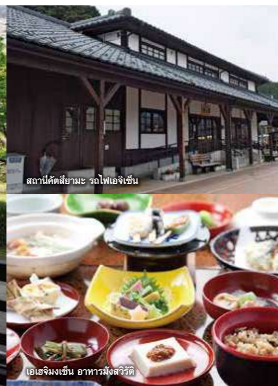
สถานีดัตสึยามะ รถไฟโอจิเซ็น