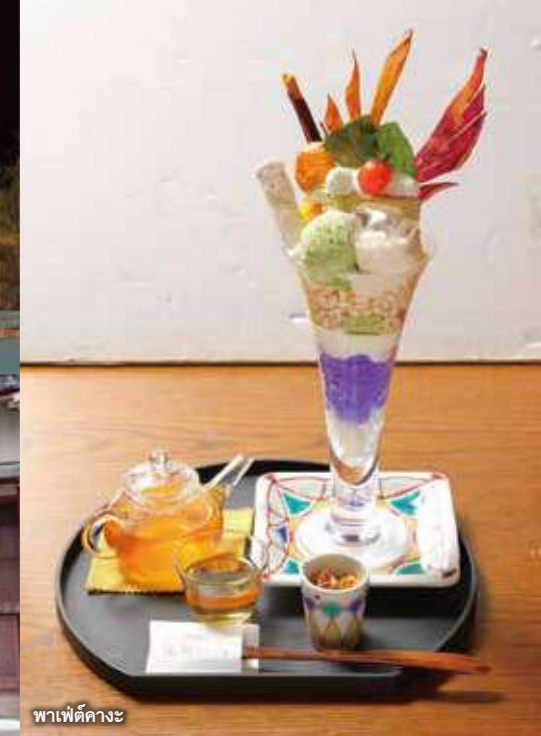
พาเฟ่ต์คางะ