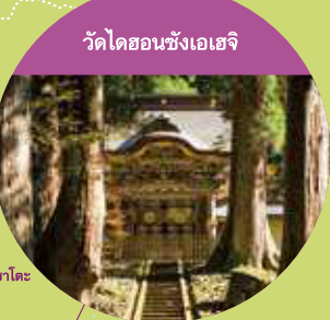
วัดไดออนซังเอเอจิ