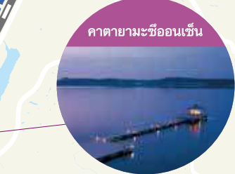
คาคายามะออนเซ็น