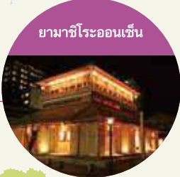
ยามาชิโรออนเซ็น